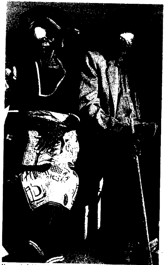
Una pareja de Mozambique a la que trató Ojos del Mundo.

Asimismo, los gazteleku acogerán una serie de talleres acerca de la inmigración a lo largo de noviembre y diciembre y la fundación Intereid-Euskal Herria organizará unos juegos de cooperación en familia. El festival de la solidaridad llegará también a la Behobia-San Sebastián con la campaña Chip Solidario que colabora con enfermos de cáncer en México. >N.C.