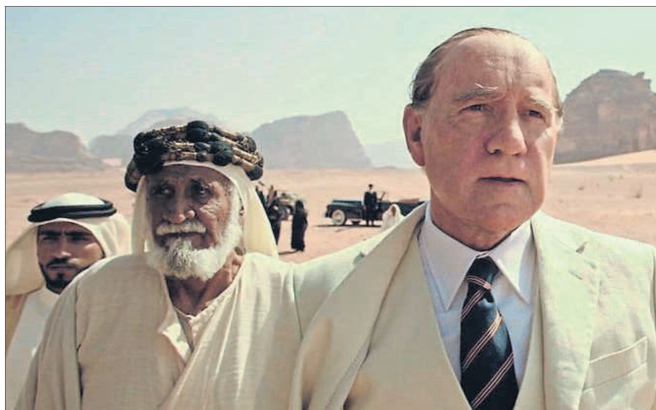
Kevin Spacey, irreconeixible en el paper de John Paul Getty, en diferents fotogrames –que seran eliminats– de la pel·lícula