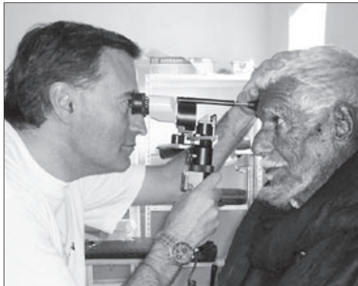
Rafart atenent un pacient en una consulta al Sàhara

A part de les expedicions on operem, també fem altres expedicions com les formatives, per exemple, per als 14 òptics que tenim al Sàhara. També fem formació pseu-